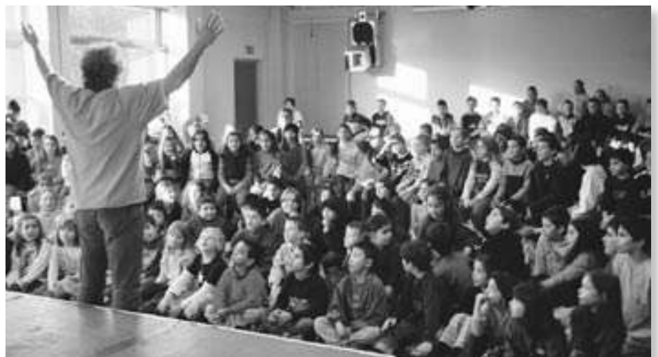
Kinder und Jugendliche im M9 – lesen Sie dazu den Bericht auf Seite 2