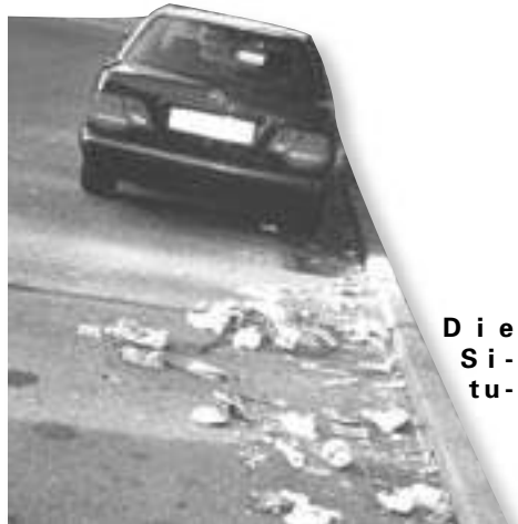
Müll – wohin das Auge nur blickt!

Уже почти 10 лет молодые люди регулярно собираются на улице между остановкой „Суттнерштрассе“, бензоколонкой и жилым кварталом „Суттнерштрассе 1-3“. Так как эти „собрания“ продолжаются до поздней ночи и вызывают в большинстве случаев шум, жители разумеется жалуются, но до сих пор напрасно. Речь идет о молодых людях, бывших жителях Фрейберга, которые теперь приезжают на машине, но также и о молодежи, которая прибывает на метро из Рота и Цуффенхаузена. Представлены молодые люди всех наций, немцы так же, как и турки, итальянцы, арабы, экс-югославы и переселенцы из бывшего СССР. До сих пор все попытки убедить молодых людей поменять их место встречи не удалась. Теперь районные учреждения, такие как дом молодежи и ЁМобильная работа с молодежью (Mobile Jugendarbeit), ставят на успех новых идей, например полуночный футбол, продленные часы работы в доме молодежи и „НИКО“. За сокращением скрывается проект ЁМобильной работы с молодежью, который должен повысить шансы молодых людей приобрести профессию. При неудаче мероприятий жители угрожают демонстрациями. Однако, еще есть время к действию.