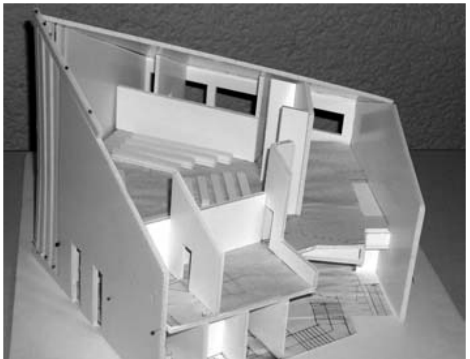
Modell Umbau ev. Kirche Mönchfeld