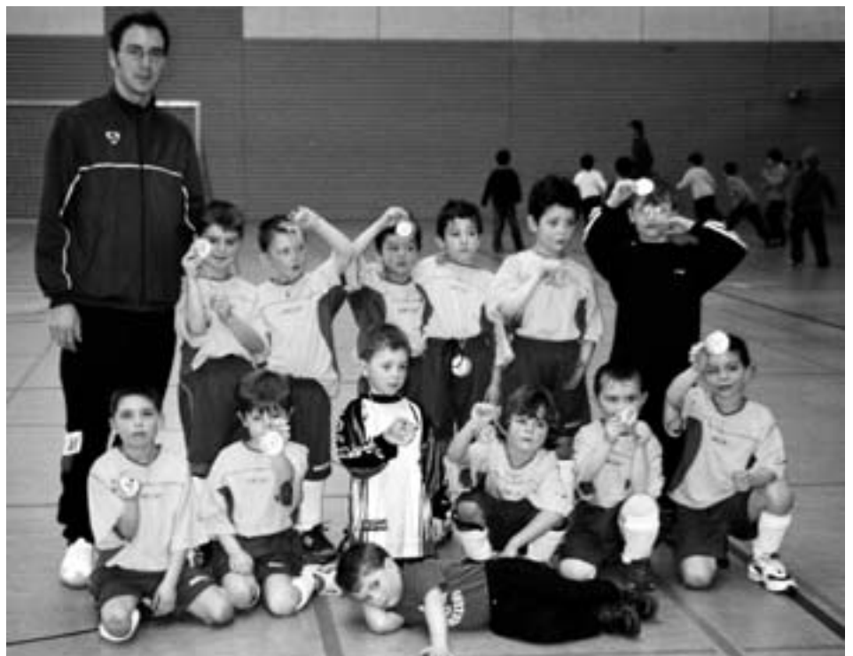
Die Mannschaft des TVC ist stolz auf ihren zweiten Platz.