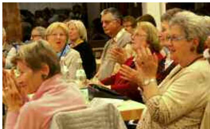
Bild 5: Begeistertes Publikum