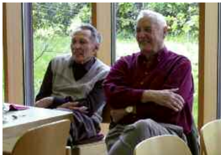
Vergnügtes Publikum: Auch die „Herren der Schöpfung“ waren voll dabei.