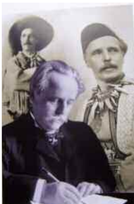
Karl May – im Hintergrund als Old Shatterhand bzw. Kara Ben Nemsi

Zufrieden waren die Karl-May-Freunde mit der Veranstaltung im Mai, dessen The-