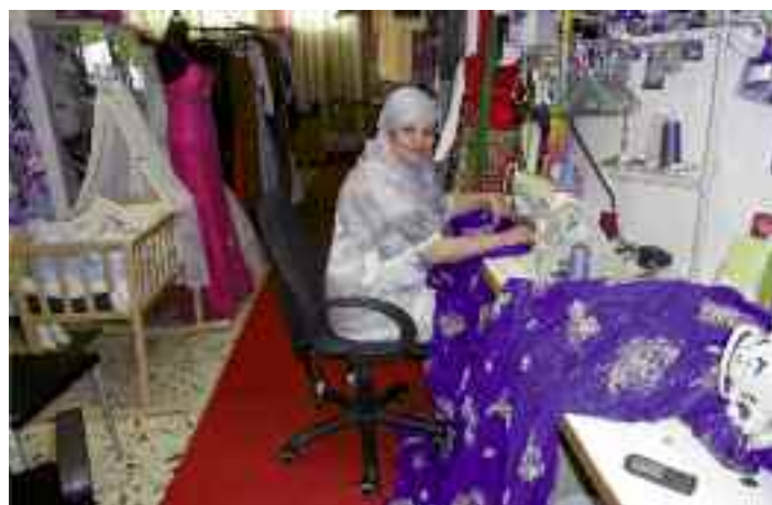
Farbenfrohe Bekleidung, Stoffe wie aus 1001 Nacht und mittendrin die Babywiege.