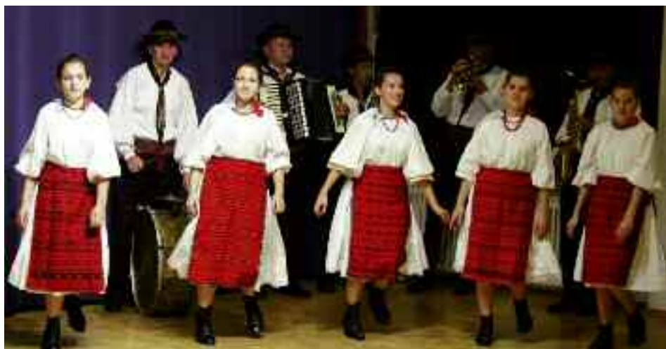
Bild 2: Folkloreensemble Rujita aus der Stadt Reps in Siebenbürgen/Rumänien

der Repser Siebenbürgensachsen, von denen sich Rujita tänzerisch inspirieren ließ. Dann folgten der flotte „Repsler Volkstanz“ der Burschen, die völlig entfesselt ihre Schenkel- und Wadelklopfereien vorführten, der entzückend grazile „Mädchentanz“ und der rasante „Fogarascher Volkstanz“, bei dem die Tänzer abwechselnd paarweise, solo oder in Gruppenformationen auftraten. (Bild 2)