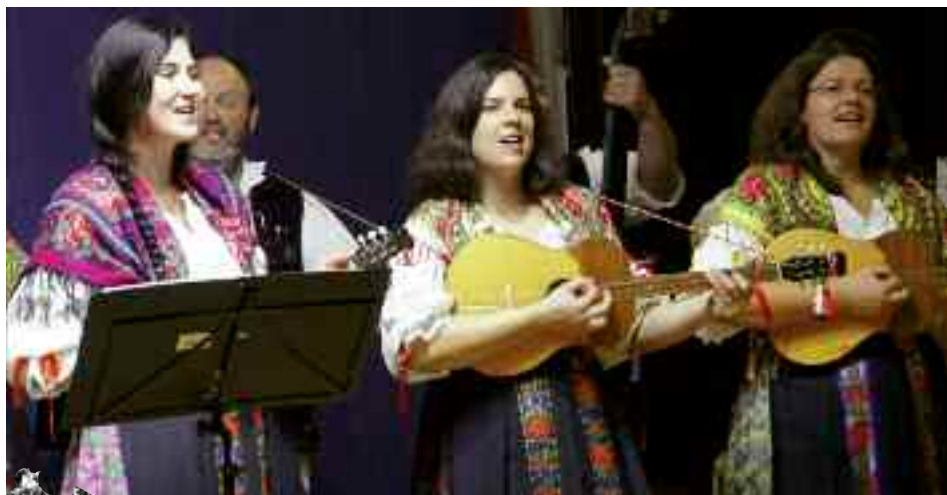
Bild 3: Das Tamburicaorchester Cindrof aus dem Burgenland/Österreich

Die mit Namen versehenen Beiträge geben die Meinung des/der Autors/in wieder. Nachdruck und die Aufnahme in elektronische Datenspeicher sind nur mit schriftlicher Einwilligung der Redaktion gestattet.