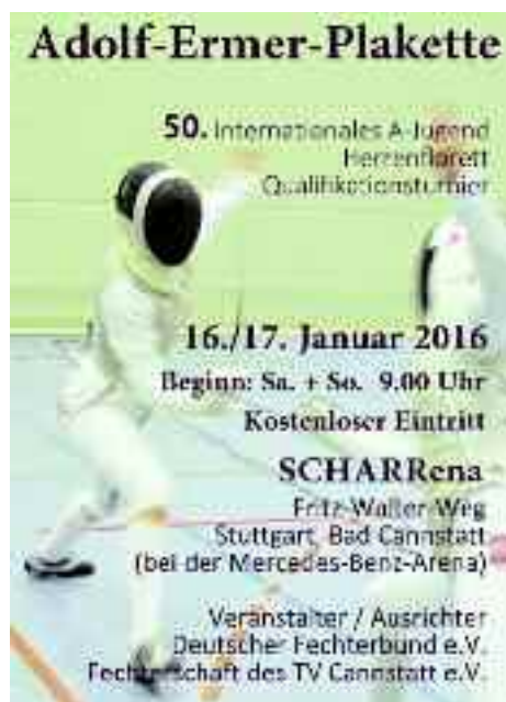
Das Plakat zum Ermer-Fecht-Turnier.

Am 16./17.01.2016 findet das Intern. A-Jugend-Qualifikationsturnier um die „Adolf-Ermer-Plakette“ in der SCHARena statt. Beginn ist an beiden Tagen