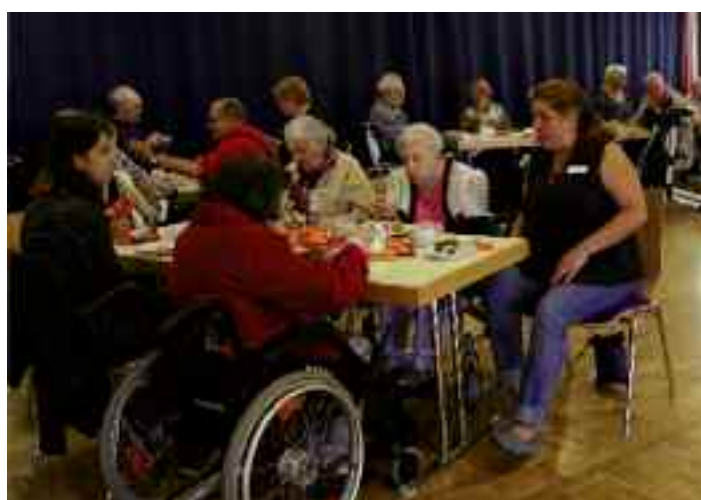
Einige der Besucher vom Wohnstift Mönchfeld