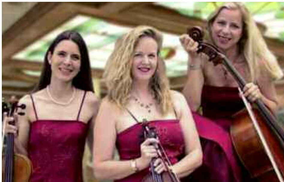
„Manon & Co.“ Adventskonzert mit 2 Geigen und Cello

Kartenvorverkauf in den Filialen der BW-Bank in Freiberg/Mönchfeld