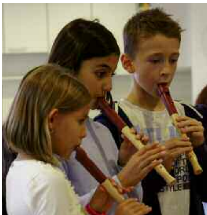
Die Blockflöten der Musikschule