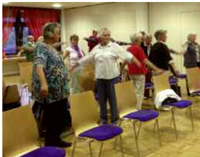
Praktische Übungen während der Veranstaltung.