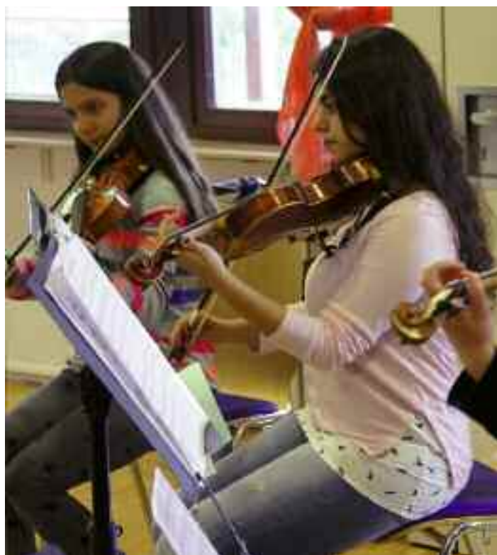
Die Geigerinnen der Musikschule