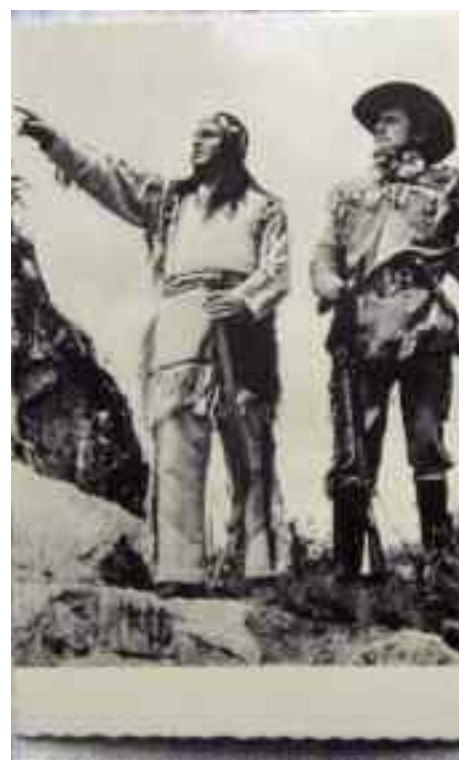
Karl-May-Spiele Bad Segeberg – Winnetou und Old Shatterhand