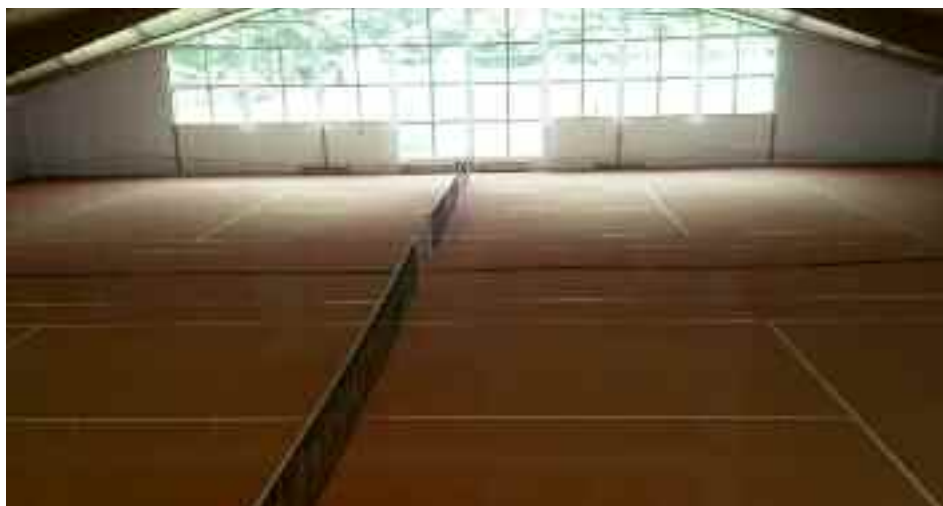
Blick in die Tennishalle des TVC.

Sie möchten auch im Winter nicht auf das Tennisspielen verzichten? Die Hallensaison läuft vom 05.10.2015 bis 01.05.2016. Unsere 2-Feld-Teppichgranulatplätze bieten eine hervorragende Möglichkeit, auch im Winter auf sandplatzähnlichem Untergrund gelenkschonend aufzuschlagen. Sichern Sie sich noch heute einen Abo-Platz beim TVC für die Wintersaison. Auch Einzelbuchungen sind selbstverständlich